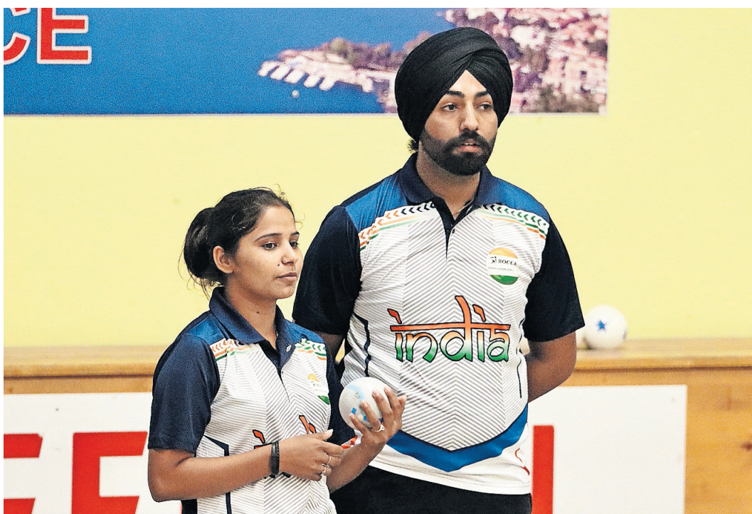
Una delle due coppie che hanno rappresentato l'India al GP Fontanaprint della Sfera.

Delle 64 coppie iscritte alla gara della Sfera, che ha chiuso uno splendido trittico del 90. iniziato con il Campionato svizzero Over 65 e quello riservato alla categoria Giovani, erano ben 12 quelle provenienti dall'Italia. E alla fine, con gli ultimi avversari ticinesi che si sono congedati dal