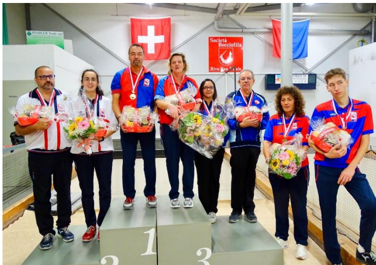
2021, Riva San Vitale