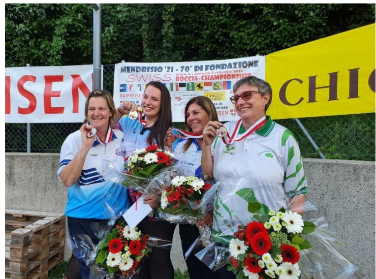
2021, Rancate